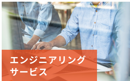
エンジニアリング サービス