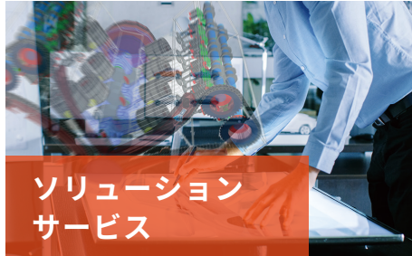
ソリューション サービス