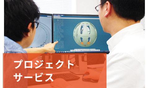
プロジェクト サービス