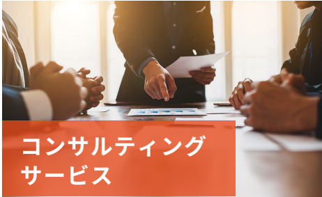
コンサルティング サービス

製品開発のあるべき姿(グランドデザイン)策定から、実現のためのシステム設計、ツール導入支援、運用定着・業務遂行まで、ものづくりのあらゆる成長課題の解決にお客様をリードしながら伴走します。そして自らも新しい技術を生み出すための研究開発事業に取り組んでいます。